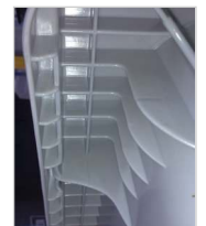
attacco a pettine di sistema a molla