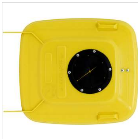
coperchio vetro/lattine - rosone 160 mm