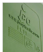
marcatura a rilievo