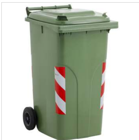
versione con catarifrangenti