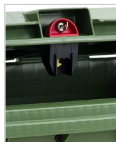
serratura a gravità modello sudhaus