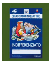
marcatura IML termoimpresca