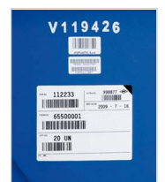
incisioni / numerazioni etichette