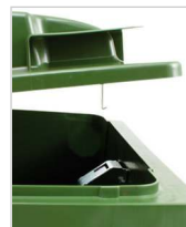
serratura a gravità centrale